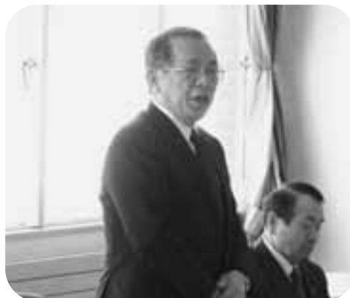
吉田代表理事組合長の開催挨拶

2月10日、JAいしかり青年部とJAいしかり女性部が同JA役員との意見交換会を開催致しました。