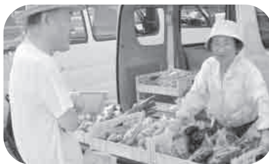
お客様に笑顔で新鮮さをアピール

た。売上も昨年度の数値を大幅に上回り、なにより一番は、お客様の声を直接聞いた生産者の方たちだと思います。「生産者からお客様へ」直売所本来の姿が垣間見えた非常に有意義な時間となりました。