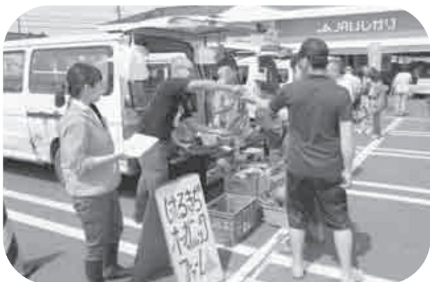
好評の対面販売で賑わう様子

8月8日と9日に、とれのさと駐車場にて、生産者による対面販売が行われました。両日合わせて10名の生産者に参加して頂き、スッキリと晴れた天候もあってか、沢山のお客様に足を運んで頂きました。8月のとれのさとのメインイベントだった今回の対面販売は、両日共に1,000人を超す集客数でした。