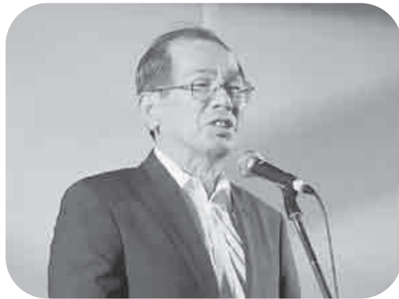
吉田代表理事組合長による挨拶