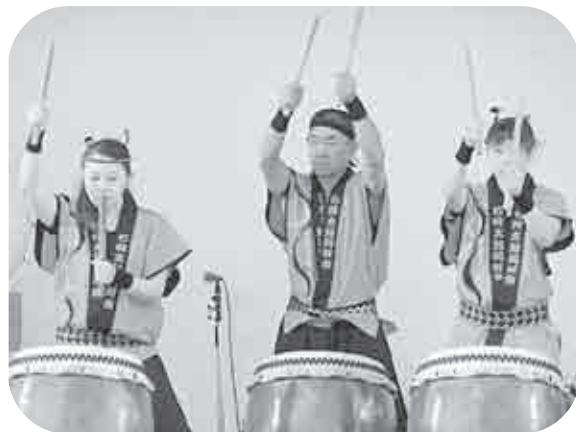
迫力の石狩太鼓同好会