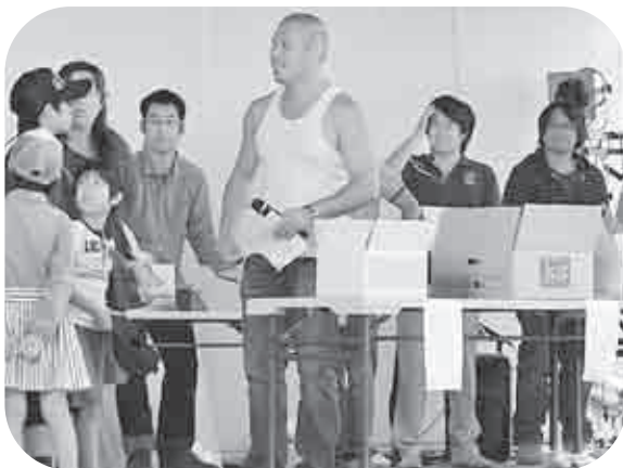
JA青年部による「野菜重量当てクイズ」