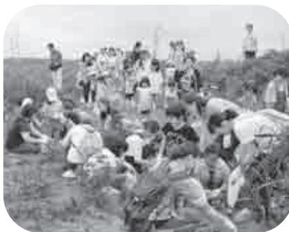
男爵いもを掘り起こし感激の園児