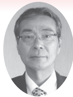
石狩農業改良普及センター石狩北部支所