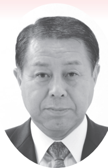
北海道農業協同組合中央会