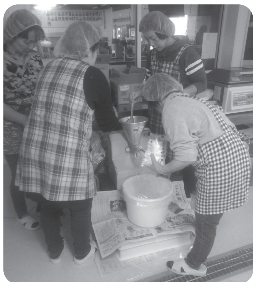
女性部の皆さんで評判の味噌が出来上がりました。大変お疲れ様でした。