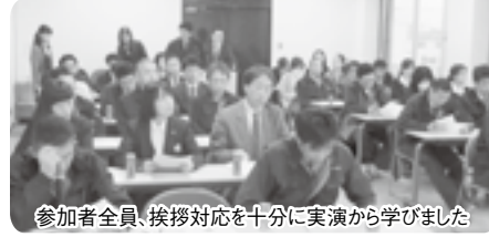
参加者全員、挨拶対応を十分に実演から学びました