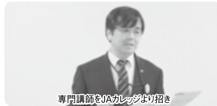
専門講師をJAカレッジより招き