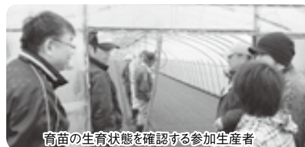
育苗の生育状態を確認する参加生産者