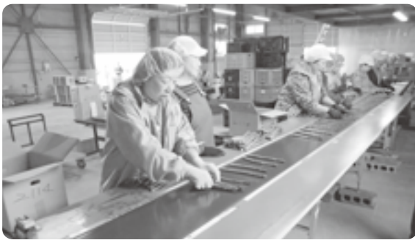
パートさんによる厳選な撰果作業