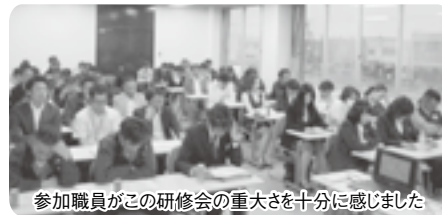
参加職員がこの研修会の重大さを十分に感じました