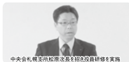
中央会札幌支所松原次長を招き役員研修を実施

また、今年度より、農協法の一部改正の概要とそれに伴い今後の農協に対する影響について研修が行われました。