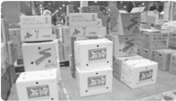
石狩産グリーンアスパラ初セリ

グリーンアスパラの共撰は、6月中旬までの約1ヶ月間行う予定となっていますので、今後は好天に恵まれて昨年以上に出荷が増える事が期待されます。