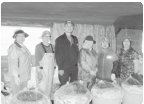
いしかり漬けの製造スタッフ一同

また、秋頃には例年同様いしかり漬けの10L樽予約受付を広報誌等でお知らせさせて頂きますので、皆様の変わらぬご愛顧の程宜しくお願いします。