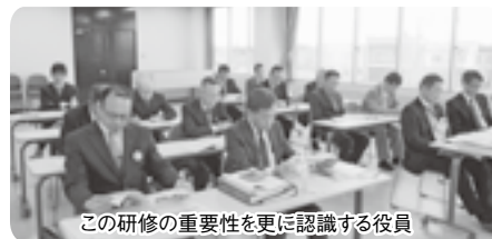
この研修の重要性を更に認識する役員