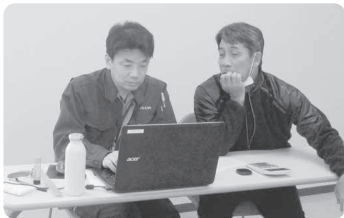
営農計画作成の様子

平成29年度営農計画書作成受付が、1月16日から27日までの日程で実施され、今年一年の収入及び支出計画を作成しました。個々の経営にあった反収・単価に基づき実現可能な計画であるか審査作成いたしました。組合員皆様のご協力により円滑に受付を完了することが出来ました。今年も組合員の皆様が計画以上の実績を達成出来るようサポートして参りたいと思います。営農計画作成後に、作付け品目や面積など大きく変更のある方は、随時営農課まで申し出頂きますようお願い申し上げます。