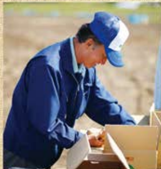
▲いつもキレイな揃別に真面目なお人柄が出ています。