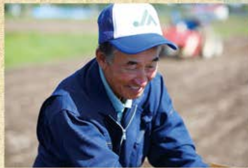
▲7・8月の早出し出荷も頑張ってください販売額ナンバー1です。