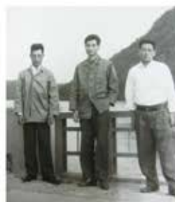
▲20代の頃、同級生と一緒に (右が静雄さん)