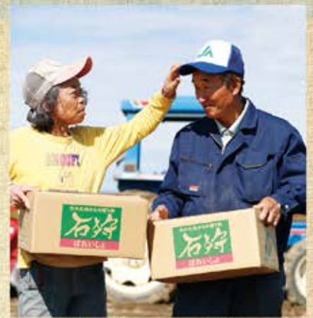
▲馬鈴薯もお二人の愛も時間と手をかけてしっかり育てられていますネ。