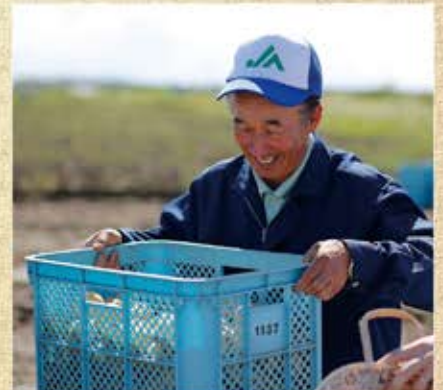
▲8月の繁忙期は連日出荷。この笑顔も一緒に消費者にお届けしたいなあ。