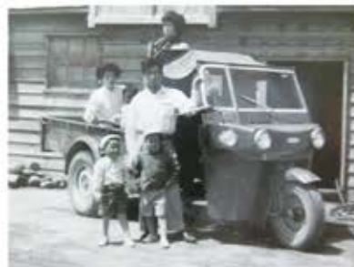
▲昭和37～38年頃、ご家族揃ってパチリ