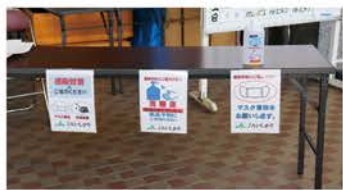
▲手指の消毒やマスク着用の徹底など、新型コロナウイルス感染症対策を実施 ▲体温測定にもご協力いただきました