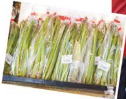
地物市場とれのさとは3月27日から 通常営業に切り替わりました。

3月27日〜28日、地物市場「とれのさと」でスプリングセールを開催し、毎年大好評の越冬キャベツ、玉ねぎ、じやがいもの特売や、新たな試みとして冷凍とうきび等を大特価で販売しました。他にも、石狩市内菓子店の大福や、厚田の道の駅で人気を集めているバター（鯖の押し寿司）など、春にふさわしい商品を多数取り揃えました。地場産の初物グリーンアスパラも入荷し、オープンと同時に売り切れになるほどの人気ぶりでした。