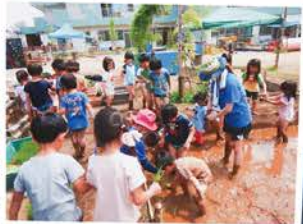
楽しんでくれている様子が伝わってきます！