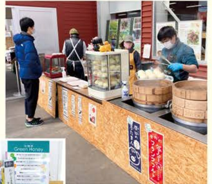
▶厚田こだわり隊にご協力いただき、厚田のふたまんやフランクフルトを販売