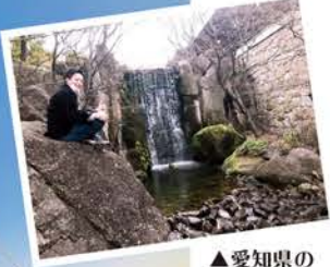
▲愛知県の徳川園にて