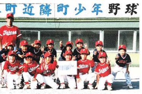
▲前列左から3番目(小学4年)