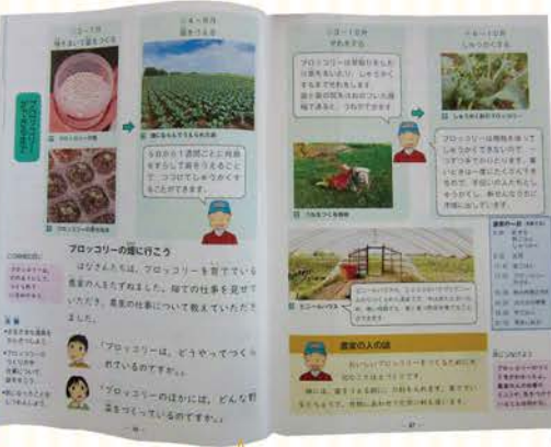
【市内3年生の社会科副読本より】 石狩市で盛んな作物や農業の説明が載っています。誌面制作時には当JAも微力ながら協力させていただきました。