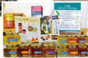
◀石狩産のハチミツ

フランクフルトなどを販売しました。 各地の花見や祭りが縮小している中で、ちよつとしたお祭り気分を味わっていただきたく開催し、連日多くのお客さまにご来店いただき、大変賑わいのあるGW期間となりました。 お米の消費が減少傾向にある今ですが、より多くのお客さまに石狩産米の美味しさをPRする場としてさまざまな催し物を今後も企画していきます。