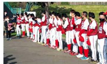
試合終了後、全員で観客を見送る選手達