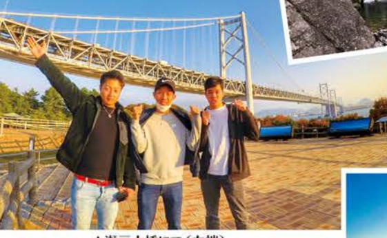
▲瀬戸大橋にて(左端)