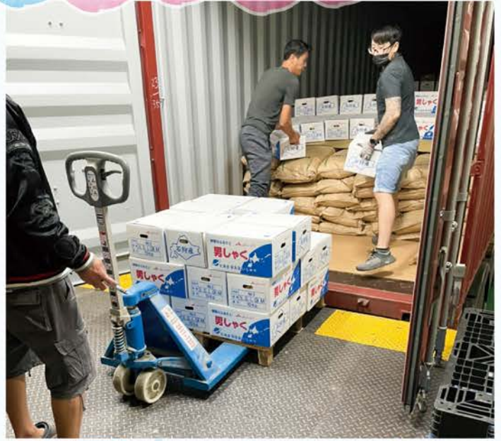
1 香港に着荷。積み下ろしの状況

その後、香港の港内の倉庫で保管されていましたが、香港市内の気温がいつも以上に高く、保管状態や環境が