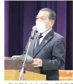
▲監査報告をする相田代表監事