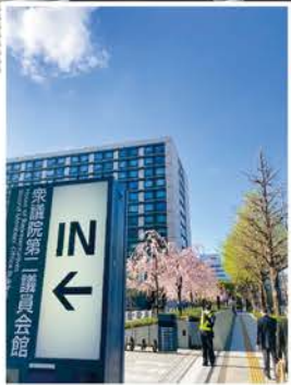
▲衆議院第二議員会館