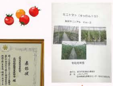
【R1】新規就農者用ミニトマト栽培マニュアル作成