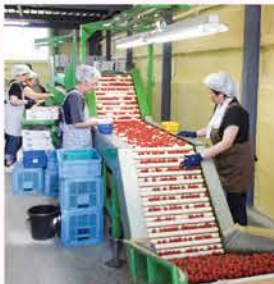
▲【H23】ベジタブルファクトリーの完成に伴い、共撰施設を移設(この年にグリーンチャウ加工・販売を開始。猛暑対策として、寒冷紗を導入。翌年豪雪による被害が発生)