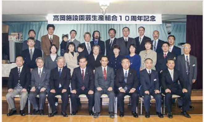
▲【H18】設立10周年記念式典開催