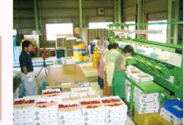
▲【H15】大型選別機を導入