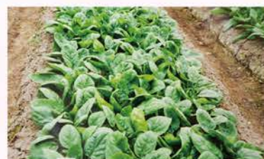
▲【H22】ハウス100棟構想がついに達成(増設事業に伴い新規野菜(小松菜・ホウレンソウ・スイートコーン)栽培を始める