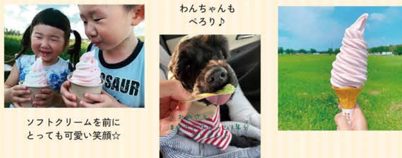
ソフトクリームを前にとっても可愛い笑顔☆