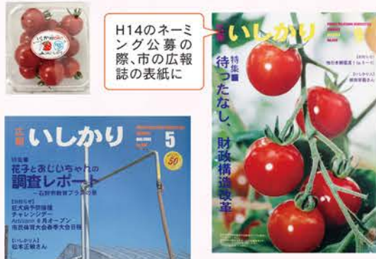
H14のネーミング公募の際、市の広報誌の表紙に

高岡施設園芸生産組合は、平成9年度に畑地灌漑排水事業を契機として5戸の生産者で設立しました。生産基盤確立のために施設園芸のハウス栽培によるミニトマトの生産に取り組み、土地利用型から労働集約型へ転換すると同時に初年度より積極的に土壌診断・経営診断・栽培技術講習などを行い、生産技術向上に努めています。また、新規就農者を積極的に受け入れ、研修指導や就農後の支援等にも尽力し、現在は18戸の生産者が加入しています。今年設立25周年を迎え、販売金額も初の2億円を達成した同組合のこれまでの歴史を、ご紹介いたします。 【記事担当：木村(雄)】