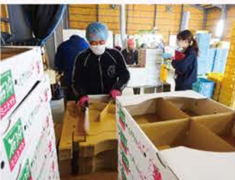
▲【H20】当JAとして初めて農福連携を開始(就労移行支援事業所あるばと協働し箱つくりを委託)