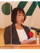
石狩市鎌田副市長