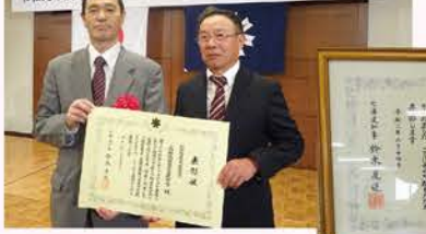
▲【R2】北海道産業貢献賞受賞【栽培の園地化、新規就農者の定着等が選定理由】(この年、食べる通信で石狩市をPR。環境モニタリングの機器設置、ハウス内データの収集を始める)