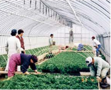
▲【H9】畑地かんがい排水事業を契機に組合設立。共同育苗ハウスを建設し、会員の作業所で共同撰果を行う