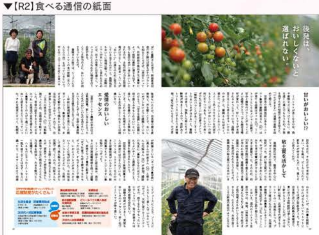
▼【R2】食べる通信の紙面