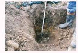
平成14年の北海道農試による土壌断面調査

【H14】通水式にて(市の広報誌より)通水前までは、トラックなどで川まで水を汲みに行き、それを畑に散水しており、大変な労力でしたが、かんがい用水のおかげで大幅な合理化と新たな事業展開の可能性が生まれた瞬間です。