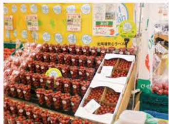
▲【H19】「顔が見える野菜」の販売開始