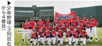
▶少年野球3列目右から4番目