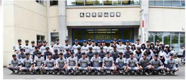
▲丘珠高校野球部(1列目左端)

2000年生まれ、札幌市出身。農協学校卒業後、令和2年4月にJAようてい入組。その後、転職を考えていたところ縁あって令和4年3月に当JAへ入組しました。趣味は野球と旅行です。現在は、妻と息子(3ヶ月)と3人で暮らしています。育児は初めてのことばかりで勉強する毎日ですが、とても充実した日々を過ごしています。