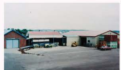
▲【H21】撰果施設を旧高岡共撰場内へ移設(この年から主枝切替法花房摘房処理を導入し、出荷量の平準化に取組む)