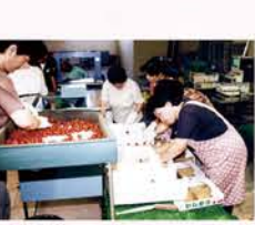
【H10】JA施設内に撰果場を設置(平成12年から撰果施設をJA機械センター倉庫へ移設)