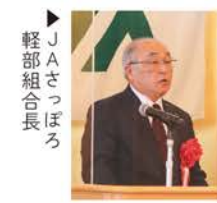
JAさっぽろ 軽部組合長