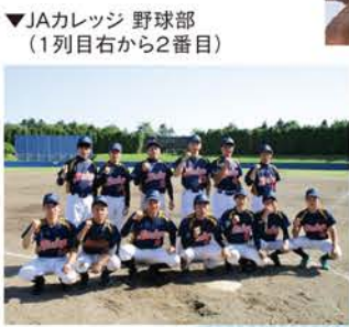
▼JAカレッジ 野球部 (1列目右から2番目)

父や友人の影響で小学3年から野球を始め、中学、高校、JAカレッジ在学中、現在まで常に野球部に所属し仲間と汗を流しています。学生時代には、野球を通して礼儀やマナー等を先輩から教えていただき、部活動引退後は、アルバイト(寿司店やラウンドワン等)を通してお客さまへの接客について学び、それらの経験が現在に生きています。高校卒業後は、即戦力の農協職員になれるよう農協学校へ進み、寮生活では常に人と接するため、コミュニケーション能力を磨くことができました。1年間寝食を共にした同期の友人が道内各地にいるのですが、そのうちの1人も昨年結婚したので、みんな大人にな