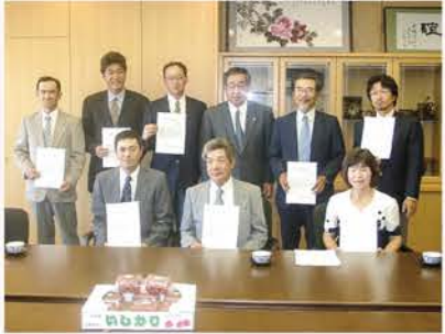
▲【H14】石狩管内では初のエコファーマー認定を受ける

【H14】公募により「いしかり DE CHU!!」のネーミングが決定し、翌年から新たなデザインで販売開始