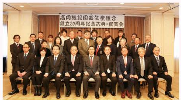
▲【H28】設立20周年記念式典開催