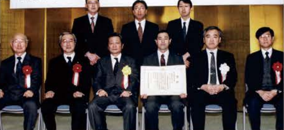
▲【H17】土地改良事業地区営農推進優良事例表彰の農村振興局長受賞(東京都で表彰式)し、全国的に評価される