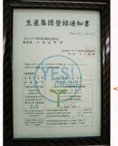
【H16】石狩市で初めてミニトマトとしてYES!clean認証を取得(この年は台風直撃による大規模な被害が発生)