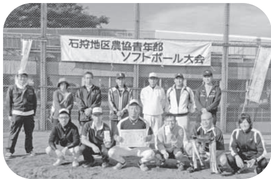
準優勝の賞状を手に誇らしげな青年部員たち

連発の堅い守備で道央混合チームを完封に抑え見事勝利。3回戦、対北いしかりAチーム戦でも勢いに乗った当チームの打線に火が付き2回表11点の大量得点の後、息の合った堅い守備を見せコールド勝ちとなりました。ブロック戦3試合を連勝に収め強豪、道央江別チームとの大会優勝を懸けた決勝戦に臨むこととなった当JAいしかり・さつぽろチーム。連戦の疲れを感じさせない見事なチームプレーで接戦を繰り広げましたが、最後は一時間の時間制限により試合終了、4回サヨナラ負けという悔しい結果となりました。優勝こそは逃したものの準優勝カップを手にするのは実に10年ぶりの快挙。最後に笑顔で整列した部員の皆さんは、しばし農作業の忙しさを忘れ、一致団結し、絆をより深める結果となりました。