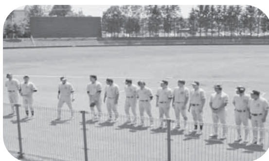
野球部の皆さんお疲れ様でした