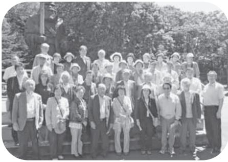
白老ポロトコタン文化像前にて友の会員

尚、年金友の会では新会員を随時募集しておりますのでご希望の方は本支店金融窓口までお問い合わせ下さい。