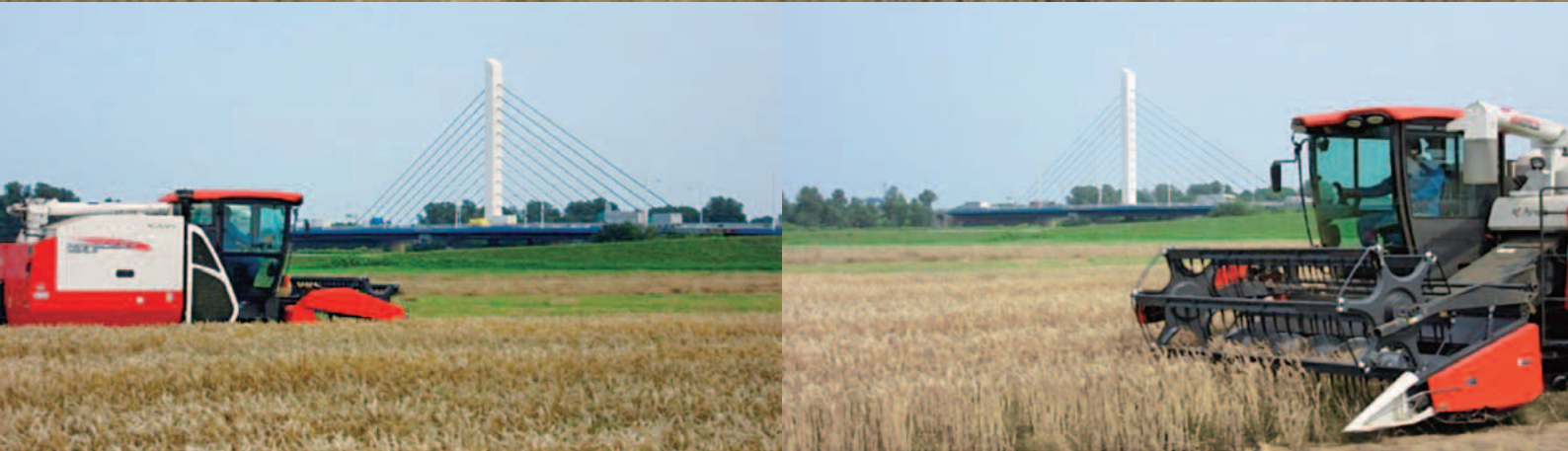
農業生産法人（株）アースワン（生振地区）小麦刈り取り作業