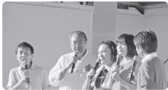
「いくぞ〜! 北の出会い旅」と「穴場ハンター」のスペシャルステージ

せておよそ5万4千人の来場者が会場を訪れ、石狩を代表する夏の一大イベントが盛大に繰り広げられました。