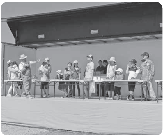
青年部「大収穫野菜クイズ」で盛り上がりました