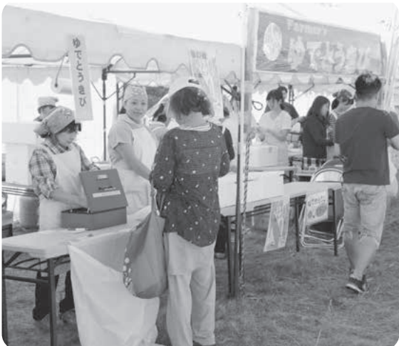
女性部、大好評の中でとうきび即売会の様子

せておよそ5万4千人の来場者が会場を訪れ、石狩を代表する夏の一大イベントが盛大に繰り広げられました。