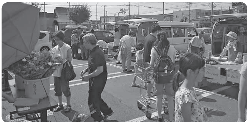
好評の対面販売で賑わう様子

今では恒例となったこのイベントは、お客様からも「生産者から直接話が聞ける」「顔が見えるので安心」と人気の高い企画で、両日ともに1,200人を超す来客をとれのさとに呼び込みました。30℃を超す真夏日となった中、出店頂いた皆様、大変お疲れ様でした。