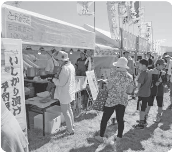
石狩春恋ラーメンといしかり漬けも大好評でした