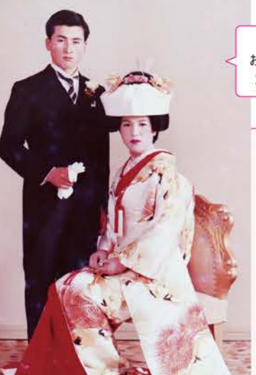
結婚はお二人とも21歳の時