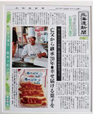
2013年3月1日の 北海道新聞に掲載されました