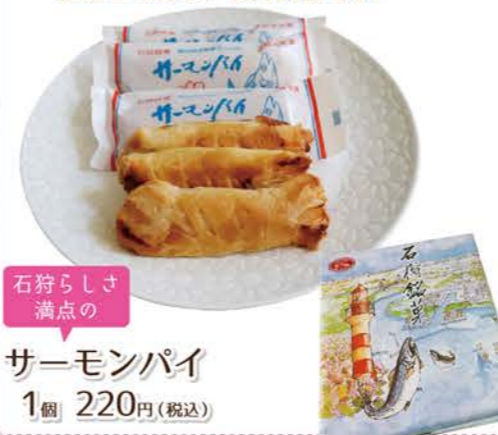
石狩らしさ 満点の

A. 「30年作り続けていますが、その日の気温や湿度によってパイ生地の状態が変わるので、この形を作るのがいまだに難しいんですよ。生地を寝かせながら完成までに4日かかり、手づくりなので大量生産もできなくて、先代の頃に新千歳空港の土産物店で扱いたいという話もあったけど断ったようです」 石狩の風景が描かれたパッケージも素敵でお土産に最適なサーモンパイは、鮭の味こそしませんが実は生地にも鮭の粉末を隠し味に使用して、ミルクたっぷりの白餡を鮭型のパイ生地で包み込んでいます。優しい甘さなので老若男女を問わず人気で、一口頬張ると何個も食べたくなってしまいます☆これからはずっと継承してほしい石狩銘菓です。