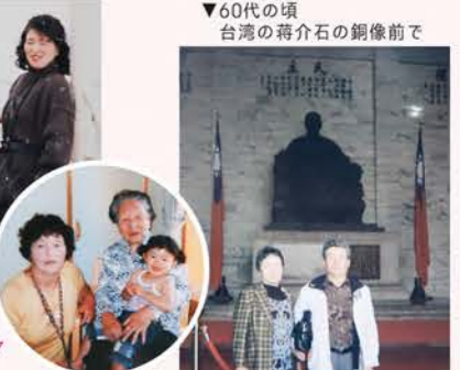
▼60代の頃 台湾の蒋介石の銅像前で