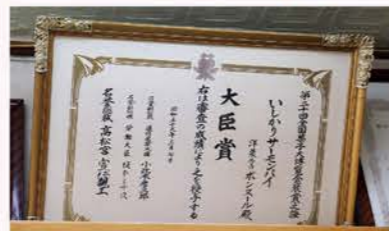
▲昭和57年に全国菓子大博覧会で 大臣賞を受賞