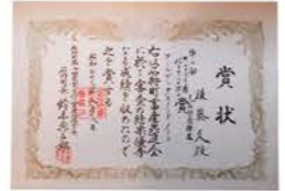
▲昭和39年に石狩町から受賞