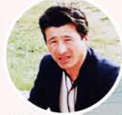
▲20代の頃 若かりし頃の久一さん