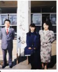
▲30代の頃 お子さんの入学式で