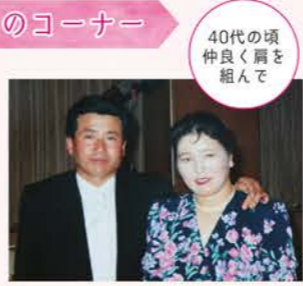
40代の頃 仲良く肩を組んで