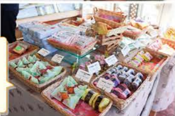
ぼん☆ろーるや ケーキ以外にも 焼き菓子など たくさん種類が あります☆

A. 「現在21歳になった息子が小学生から野球をやっていた関係で、土日は中学硬式野球ボーイズリーグの審判をしています。早朝からケーキを焼いて、しっかり仕事してから向かうんですが、子ども達には癒やされますね。その繋がりから、以前、某有名選手の2000本安打記念に自分のケーキを食べてもらえて、とても良い思い出になります」 店内に写真やサインも飾られていますので、来店時に探してみてくださいね。