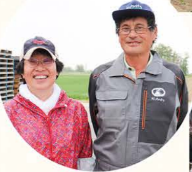
最後に地物市場とれのさとで平松農産振興係長から地産地消の取り組みについての説明を行いました☆