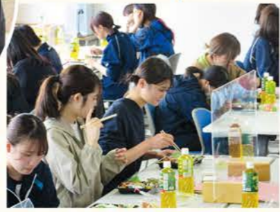
楽しい昼食タイム