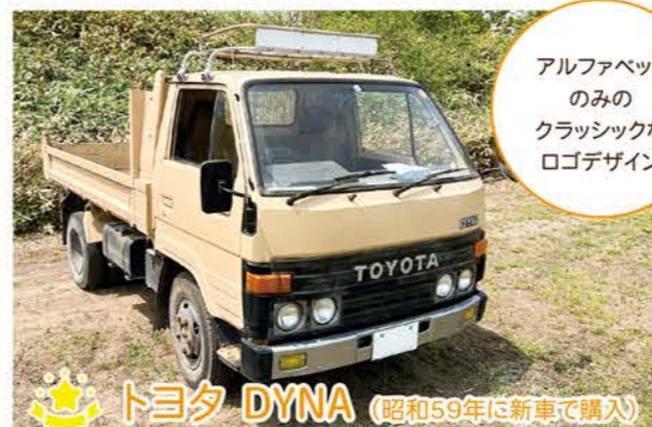
アルファベットのみのクラシックなロゴデザイン