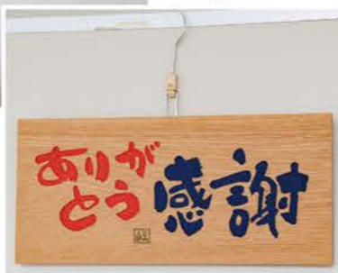
お家の中はステキな作品でいっぱい☆