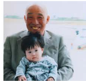
長男の一人息子と (1歳頃)

最初は南瓜部会の有志で加工品を作ろうと話して、23歳の時に初めて保健所に申請しに行ったんだけど、なかなか申請が通らなくてね。何度も通って、結局、保健所の許可が下りたのは30歳だったんだけど、その間に1人抜け、2人抜け…残ったのは自分だけで(笑)。敷地内にカボチャようかんを作る加工所も作って、品種や配合を変えながら試作を繰り返して商品化したんだよね。12~6月の農閑期に製造していたけど、カボチャを裏ごしするのがなんせ大変。寝ないで作ってたね。一度に沢山作れないから個数限定でAコープやさとらんど、喫茶店などで販売してもらっていたよ。大通りのオータムフェスタに出店したこともあったね。本州からも注文があったけど、甘味料や防腐剤を使っていないから要冷蔵で2日しか日持ちしなくて、仕方なくお断りしていたよ。