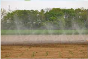
ブロッコリー畑への散水の様子も見学しました。