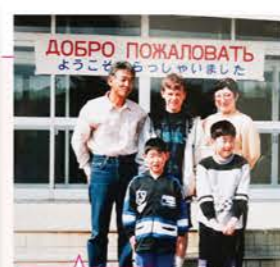
ロシアからの留学生を受け入れ 藤男さん(40代) 寿子さん(30代)