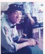
藤男さん(10代) ガソリンスタンド時代