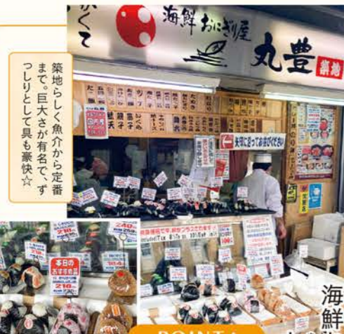
築地らしく魚介から定番まで。巨大さが有名で、ずっしりとして具も豪華☆