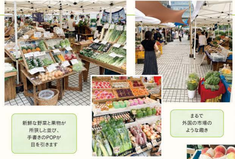
新鮮な野菜と果物が所狭しと並び、手書きのPOPが目を引きます