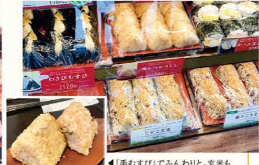
「手むすび」でふんわりと。玄米も柔らかくプチプチ感がたまらない☆