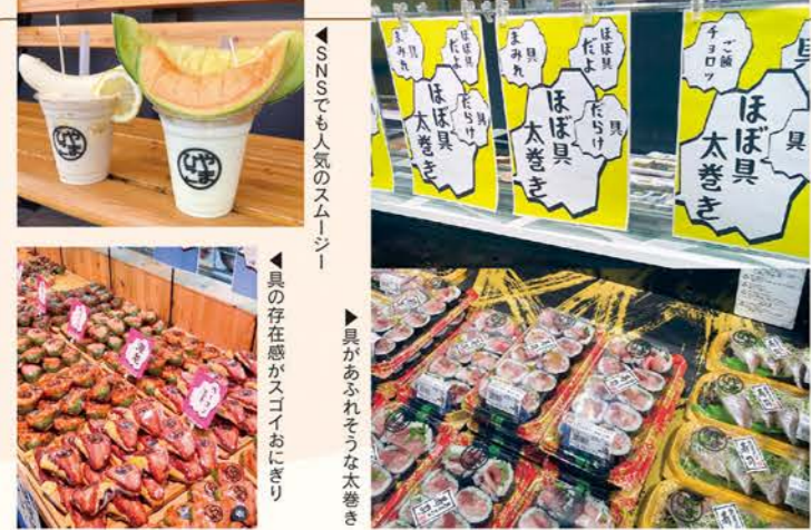
SNSでも人気のスムージー