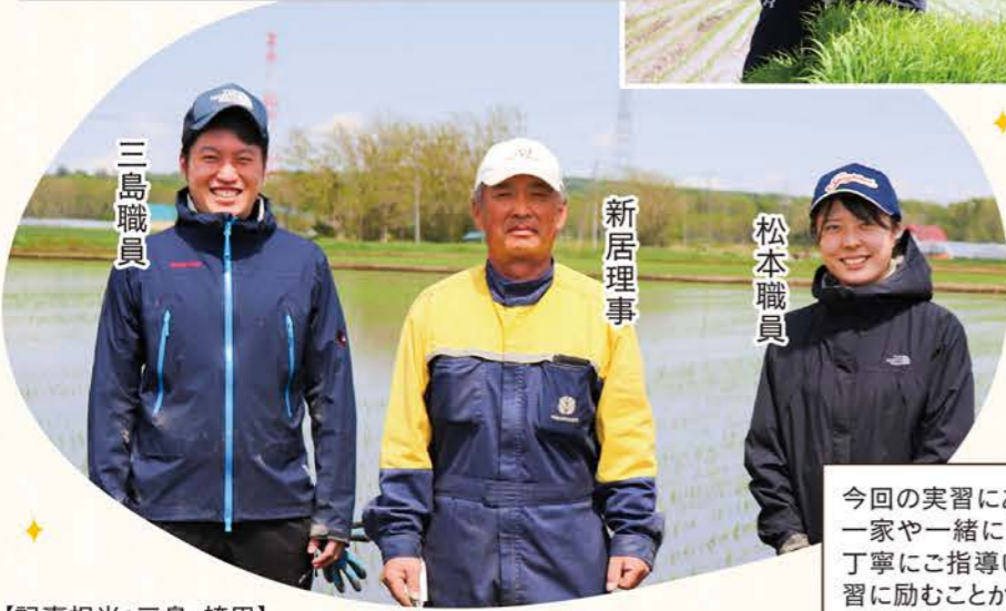
【記事担当:三島・袴田】

今回の実習にあたり、快く受け入れてくださった両理事ご一家と一緒に働かせていただいた皆さまには大変優しく丁寧にご指導いただき、非常に働きやすい環境の中で実習に励むことができました。本当にありがとうございました。