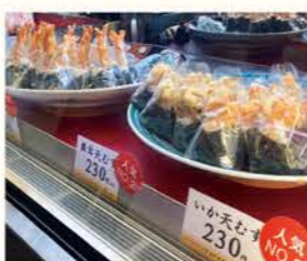
こだわりの食材を贅沢に。北海道の味は「じゃがバター」