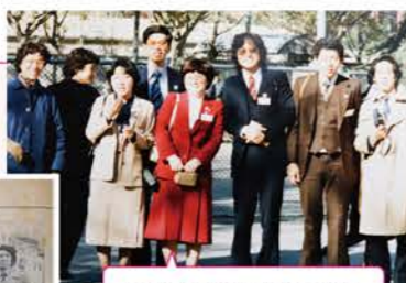
寿子さん(10代) 右から4人目 青年団で海外研修へ