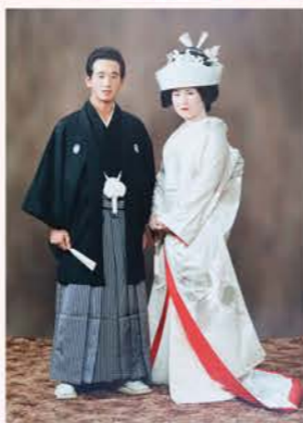
▲藤男さん(28歳)・寿子さん(22歳)の時に結婚