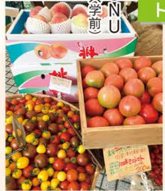
まるで外国の市場のような趣き

毎週土日、広場マルシェ(市場)がたち、農林水産省の補助プロジェクトとして始まった都市住民参加型市場「マルシェ・ジャポン」(全国8都市で開催)の1つ「ファーマーズマーケット@UNU」です。 野菜や果物のことは育てた農業生産者が最もよく知っており、おいしい食べ方、調理の仕方を生産者が直接対面して消費者に伝えることをコンセプトにしています。 販売ブースでは、野菜を魅力的に見せるためのディスプレイや試食などを工夫して消費者との会話のきっかけとしていました。また、自らの生産物である野菜や果実への付加価値付与の認識も高く、例えば市場では規格外となるような曲がったキュウリも安く売るのはなく、なぜそうした形状なのか味はどうなのかをきちんと説明していました。それは生産者だからこそ伝えられることであり、双方にとって非常に良いコミュニケーションと感じました。 来場者は1日平均1万人で、30～40代の女性や親子が多く、近隣のシェフも訪れています。