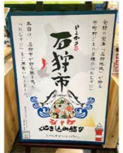
おむすび「いしかり8」の無償配布 (各日限定200個)