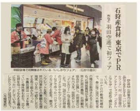
▲北海道新聞 (令和5年2月28日掲載)