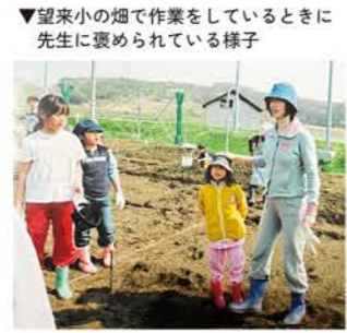
▼望来小の畑で作業をしているときに先生に褒められている様子