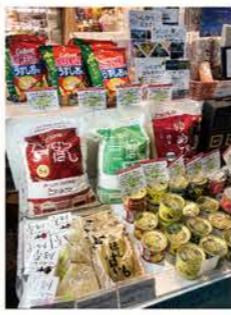
▲石狩産米 (ななつぼし、ゆめぴりか)