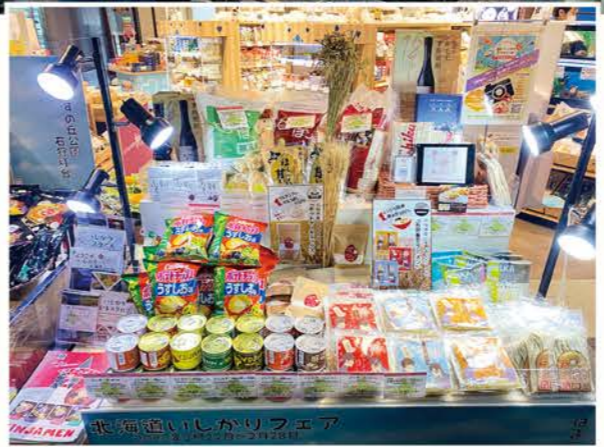
▲当JAからは米粉のホットケーキミックスや生パスタなど計10品を出品