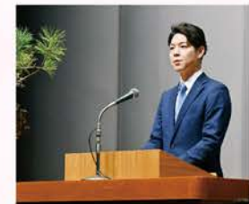
◀鈴木知事も来賓として臨席されました