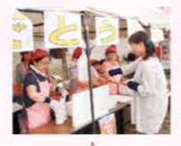
H26 石狩まるごとフェスタ