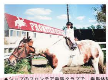
▲シップのフロンテア乗馬クラブで、乗馬体験

3歳の頃に父の転勤で石狩市望来へ引っ越しました。シッps保育園では、落葉キノコ採りや、サツマイモを育て焼き芋にしたり、自然とたくさん触れあひながら育ちました。新鮮な野菜の美味しさを知ることができたので、卒園する頃には好き嫌いもなくなりました。望来小学校でも畑で野菜を育て、農業に関わることが多かったのですが、とても良い経験ができたと感じています。幼少期に過ごした石狩市は空気がとても澄んでいて(夜は星空がすくく綺麗)、自然の中でたくさん遊べた記憶があり、将来子どもができたなら、野生児のような生活をさせたいので、石狩市に住むのもイナと思っています。小学2年の夏に札幌市へ引っ越し前まで、望来小学校のバレーポ