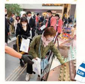
北海道産牛乳の無償配布 (各日限定100個)