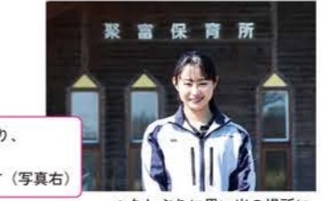
▲久しぶりに思い出の場所に