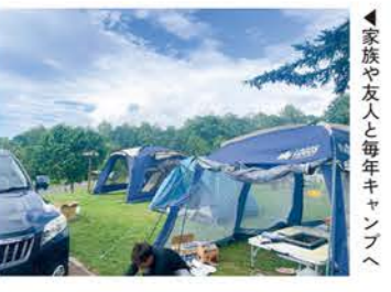
▲家族や友人と毎年キャンプへ