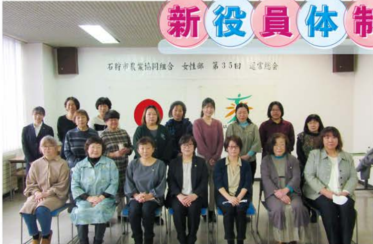
石狩市農業協同組合 女性部 第35回 運営総会