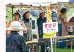
▲H14：農業まつり参加【当年度は部員106名（管内5組織）】