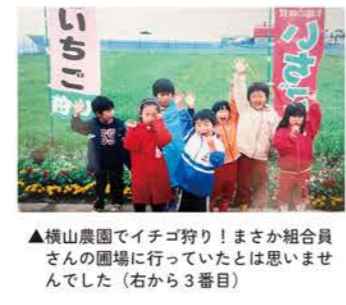
▲横山農園でイチゴ狩り!まさか組合員さんの圃場に行っていたとは思いませんでした(右から3番目)