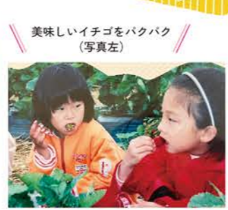
美味しいイチゴをパクパク(写真左)