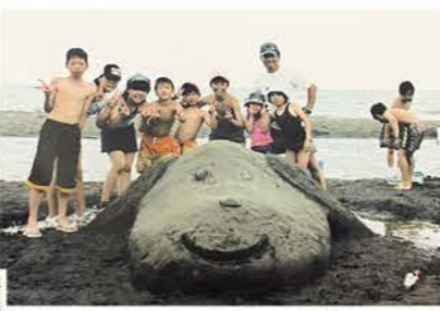
▲望来海水浴場で小学校のみんなで砂のスノービーを作りました(前列右から2番目)