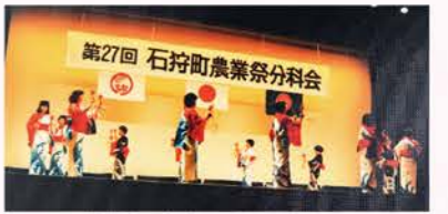
▲H1：農業祭で各地区が踊りを披露（当時は北コミセンで分科会を行われた）