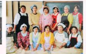
▲H5：味噌造り（美登位支部） 【当年度は部員299名（管内16組織）】