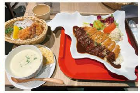
北海道をかたどったプレートが人気でした