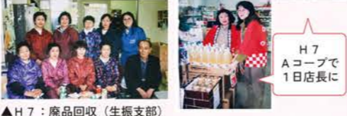
H7 Aコープで1日店長に