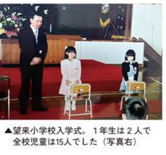
▲望来小学校入学式。1年生は2人で全校児童は15人でした(写真右)