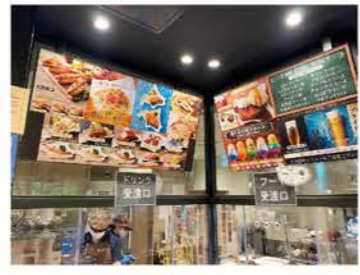
360度の多面映像による石狩管内のPR