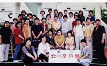
▲H11：視察研修（80名参加：写真は石狩支部と役員）