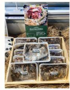
▲とれのさと オリジナルジギスカン