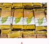
H24 コンスープ、カボチャスープ製造