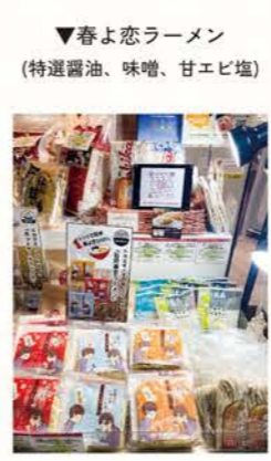
▼春よ恋ラーメン (特選醤油、味噌、甘塩塩)