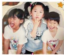
保育園でよくおやつを作り、一人倍食べてました。この頃から食べるのが大好きです(写真右)