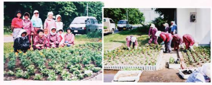
▲合併当初は3地区の特色が強かったものの、共通した活動の1つに「花いっぱい運動」を取り入れ、先進地への視察研修をきっかけに調和が図られ活動が活発化。地道な運動の後、市の「花壇コンクール」に参加する部員が増加し、地域ぐるみの取り組みへ発展