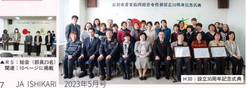
▲R5：総会（部員23名）関連：10ページに掲載