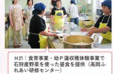
H21：食育事業・幼P連収穫体験事業で石狩産野菜を使った昼食を提供（高岡ふれあい研修センター）