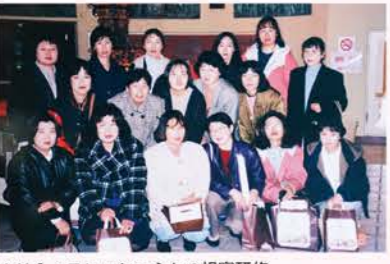
▲H8：フレッシュミセス視察研修