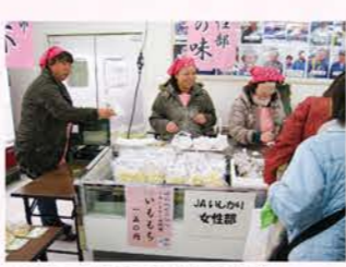
▲H26：味本市（inとれのさと）