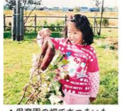
▲保育園の畑でさつまいも収穫の様子

札幌市出身。2022年4月に入組。幼少期は石狩市で過ごしました。石狩南高校卒業後、釧路公立大学に進学し釧路市で一人暮らしをしていましたが、現在は実家に戻り、家族と暮らしています。趣味は旅行、美味しいものを探すこと(焼肉、お寿司、カレー、フルーツ、チョコレート...etc)、休日にまったりとアニメを見ることです。今は日本中を熱狂させたWBCに影響されて「メジャー」という野球のアニメを見ています…(笑)