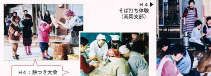
H4：そば打ち体験（高岡支部）