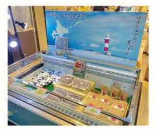
石狩管内の色とりどりの商品が並びました