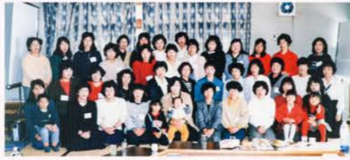
▲若妻がH4年度からフレッシュミセスに名称変更、その後フレッシュミズに