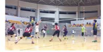
大学時代、ミニバレー大会のときの写真(背番号11番)