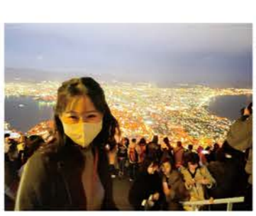
▲趣味の旅行で函館へ