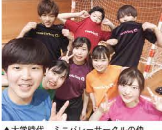
▲大学時代、ミニバレーサークルの仲間との写真(オレンジ色のTシャツ)