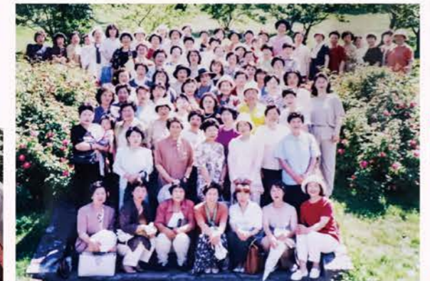
▲H9：設立10年目 部員243名（石狩支部95名・花畔支部65名・生振支部83名）写真は90名参加の視察研修