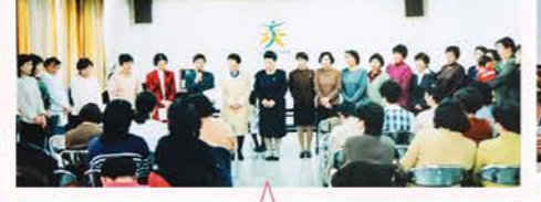
H8：マークも新たに「婦人部」から「女性部」に名称変更。行政も「町」から「市」へ。「女性部5原則」への変更に伴い、旧婦人部5原則で謳われていた「働く農村婦人」でなくても入部可能になり、非農家女性にも参画の和を広げる（写真は総会）