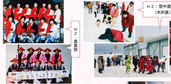
H2：雪中運動会（本所裏）