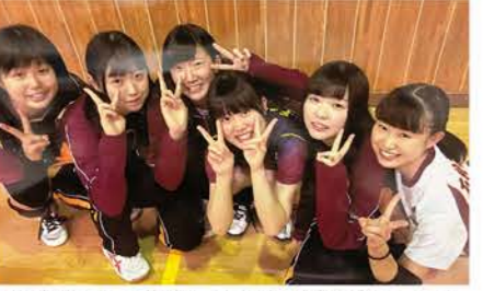
▲石狩南高バレー部時代。ポジションはリベロで、中学時代はセッターでした(右端)