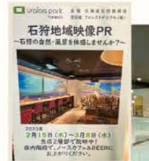
石狩地域映像PR 一石狩の自然・風景を体験しませんか?