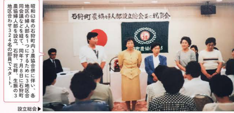
昭和63年の石狩町内3農協合併に伴い、各地区の婦人部を1つにするために3地区合同会議を経て、同年7月8日に3地区合同農協婦人部を設立。石狩、花畔、生振の3地区合わせて324名の部員がスタート。

このコーナーでは、各部門の軌跡をたどり、JAいしかりの歴史をさまざまな角度でご紹介します。第3回目は女性部です！ 【記事担当：袴田】 女性部は3農協合併後、各地区独自の活動（敬老会、手伝い、村民運動会、盆踊り、交通安全啓発、料理講習、日帰り研修など）のほか、農業祭参加、料理講習会、食育事業、先進地視察、石狩産農産物PR、平成23年から加工事業などを行い、地元になくてはならない存在として活動しています。