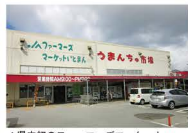
▲県内初のファーマーズマーケットいとまん『うまんちゅ市場』