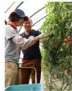
H29：1分間CM JA道女性協会会長賞受賞