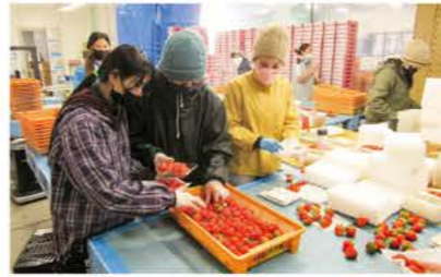
▲撰果場でイチゴのバック詰め作業をする多くの外国人技能実習生