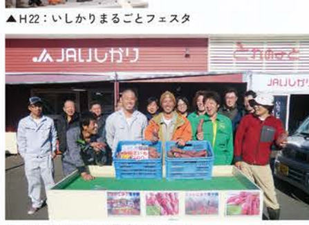
H22：いしかりまるごとフェスタ