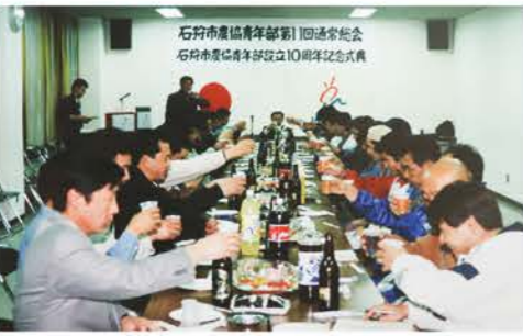
H10：設立10周年記念式典