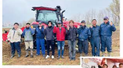
R3：スマート農業実演会