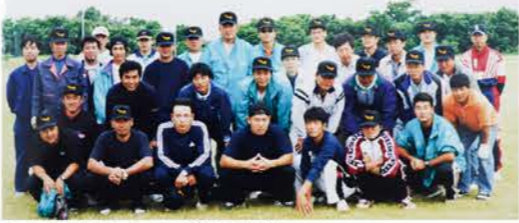
H11：ソフトボール大会地元開催