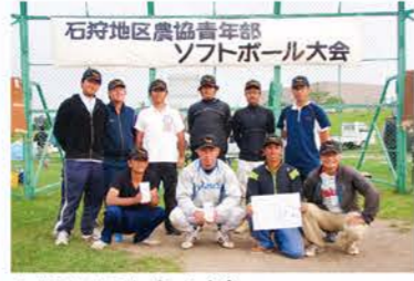
H26：ソフトボール大会