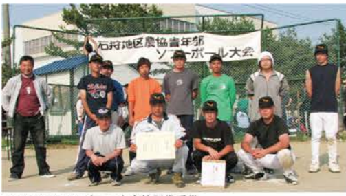
H20：ソフトボール大会特別賞受賞