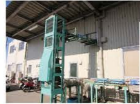
原料出荷ケースの 自動洗浄！ メーカーは 『シブヤ精機(株)』