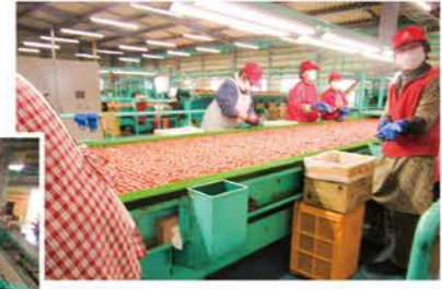
形状選別機6レーン とても長い粗選別ラインで 熟練のパートさんが活躍！