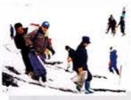
H11 スノーメッセージ