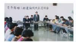
H4：青年部婦人部農協役員懇談会