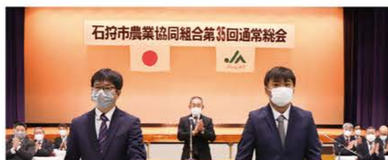
▲開会に先立ち、新規就農者2名へ新規就農者激励状授与を行いました

4月7日、第35回通常総会を花川北コミュニティセンターで開催しました。この度の通常総会は、2月の臨時総会で合併を承認いただいたことに伴い10月1日に新JAに移行されるため、石狩市農業協同組合として最後の通常総会となります。今回は4年ぶりに来賓を招待し、マスク着用の徹底と体温測定や手指の消毒、座席間隔の保持などにご協力いただきながら、感染症拡大防止に努めた中で実施しました。 議事では、令和4年度事業報告、貸借対照表、損益計算書、剰余金処分案および注記表の承認、令和5年度事業計画などの議案を上げ、活発な質疑応答の中で貴重なご意見を多くいただき全件賛成多数で提案通り承認され、盛会のうちに終了しました。 今後は、10月の合併に向けて組合員皆さまの負担に配慮するとともに、円滑な合併手続きに万全を期してまいります。 【記事担当…袴田】