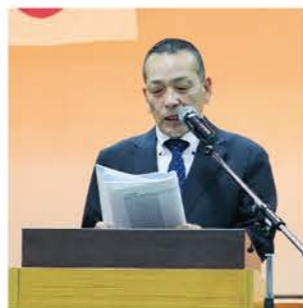
▲監査報告をする相田代表監事