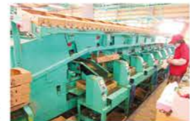
規格毎に箱詰めし、 ベルコンで荷積みされる ミニトマト