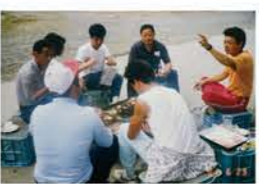
H3：青年部・青年会・農協職員との親睦事業