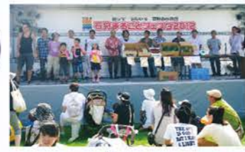
H24：いしかりまるごとフェスタ 野菜重量当てクイズ（部員29名・地区5単組・道60記念誌より）