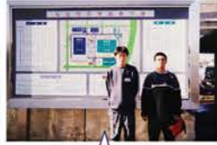
H12：S44に初参加した道外研修及び移動村づくり研修（部員41名・地区9単組・石狩50記念誌より）