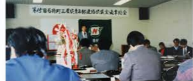
S46に3農協連絡協議会が発足。（写真はS61：石狩町三農協青年部連絡協議会通常総会）

各青年部が旧農協に発足（石狩町農協：S27、花咲農協：S29、生振農協：S33（S25に結成の農業研究グループ「土の香サークル」が基礎）し、3農協合併前から交流していました。（写真はS59：石狩町三農協青年部研修会）