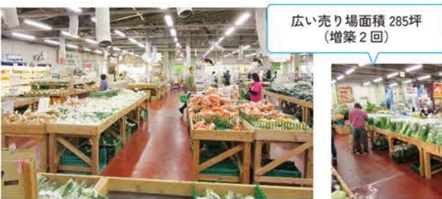
広い売り場面積 285坪(増築2回)