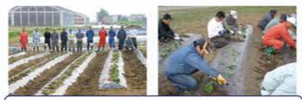
H23：振興作物（サツマイモ）栽培事業開始・対面販売