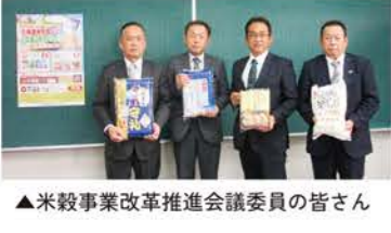
▲米穀事業改革推進会議委員の皆さん