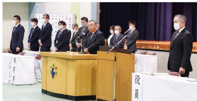
▲花田市議会議長による万歳三唱