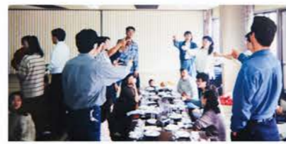
H5：フレッシュミセスとの交流会