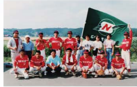
H2：ソフトボール大会

S63：石狩地区の野球大会・ソフトボール大会を地元開催し運営も行う。野球7チーム、ソフトボール13チームが参加。先輩達が苦労して制作してくれた赤と白のツートンカラーのユニホームで参加。（野球はこの年が最後）