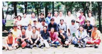
H10：ソフトボール大会