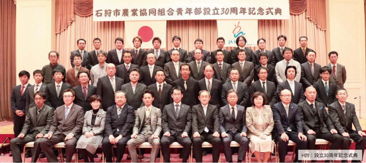
H29：設立30周年記念式典

このコーナーでは、各部門の軌跡をたどり、JA いしかりの歴史をさまざまな角度でご紹介します。第4回目は青年部です！ 【記事担当：袴田】