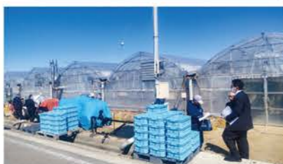
▲野菜ソムリエサミットで2回連続銀賞受賞のこだわりの『ソムリエトマト』を作っている3棟一続きのハウス

熊本県でトマトを栽培して75年、(株)レッドアップのハウスは台風対策のため、とても頑丈な作り