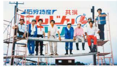
S60：旧石狩町農協青年部で鉄板を溶接して制作した看板（合併以降も共撰箱のデザインとして使用）