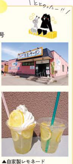
▲自家製レモネード

住所：札幌市西区発寒7条14丁目16番15号 電話番号：011-669-1004 営業時間：平日 / 12:30~23:00 土日祝 / 9:30~23:00 (最終受付 22:30) 定休日：木曜日(祝日は除く) 利用料：大人 480円(サウナ利用+100円) 小学生 140円、幼児 70円