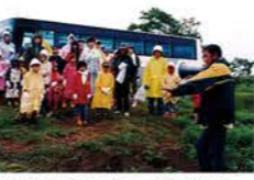
H15：ミステリーバスツアー