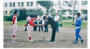
H6：ソフトボール大会で特別賞受賞