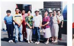
H6：消費者協会現地視察交流会