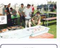
H18 ミステリーバスツアー