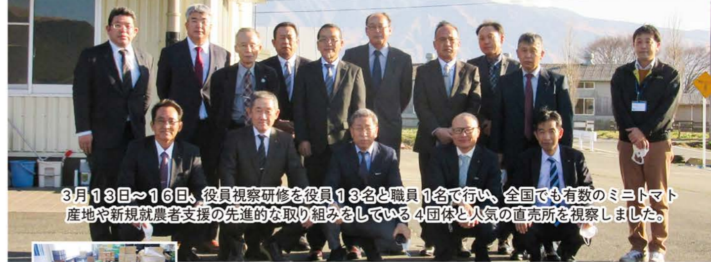
3月13日～16日、役員視察研修を役員13名と職員1名で行い、全国でも有数のミニトマト産地や新規就農者支援の先進的な取り組みをしている4団体と人気の直売所を視察しました。