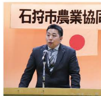
▲平野中央会札幌支所長