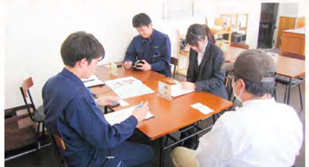
▲取材風景がInstagramに掲載されました!!

A. 施設利用者さんが工場で一生懸命作ったパンですので、就労施設ではなく「パン屋」として認知されるよう意識し、また、品質の維持も重点的に掲げてパン作りを続けてきました。石狩産小麦などを使うことで地産地消・地域密着型のパン屋として今では人気店となっています。