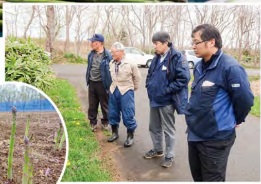
▲現地検討会の様子

今年のグリーンアスパラは、例年以上に雪解けが進み生育がかなり早くなると当初予想していましたが、4月はなかなか気温が上がらずに霜による影響もあり心配されましたが、5月の気温上昇により結果的には昨年よりも2日早い共撰開始となりました。