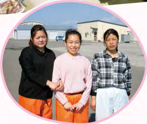
✿ ウさん (39歳) ✿

今回、来日された3名ともに既婚者で、ご家族を中国に残して来ていますが、スマホを使いインターネットで毎日ご家族と連絡をとっているそうです。日本語は不慣れでまだ挨拶程度ですが、細かい部分は翻訳アプリを駆使して担当者と意思疎通を図っています。