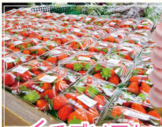
イチゴソフト 310円(税込)

こちら是非一度お口にしてみたいはいかがでしょうか？原料に限りがあり期間限定商品となっていますのでどうぞお早めに・・・