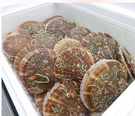
浜益産活ホタテを限定販売!!