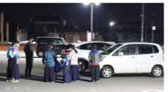
▲毎回子ども達が自主的に先生達を見送りに外へ