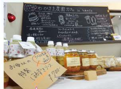
大人気!! わがまま農園カフェも出店