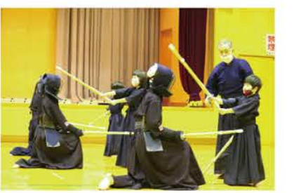
休時間には笑顔も

只今流行の「鬼滅の刃」が剣道界にも広がっており、鬼滅の刃のキャラクター柄の「手ぬぐい」や「鏝」「マスク」を付け、小学生も楽しみながら稽古に励んでいます。周りに剣道に興味のあるお子さまがいらっしゃいましたら是非石狩東剣道スポーツ少年団へ!!