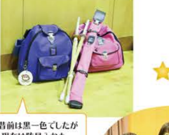
一昔前は黒一色でしたが現在は防具入れもカラフルでオシャレです