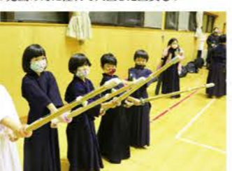
鬼滅の刃に憧れて入団した団員も