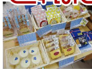
プリンやクッキー、ラスクなど 美味しい商品がたくさん♪