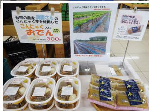
石狩産こんにゃく芋を使用した こんにゃく入りの石狩おでんを初販売