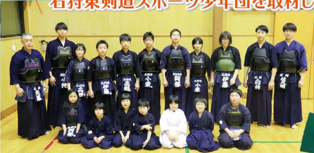
※写真撮影時のみマスクを外していただきました