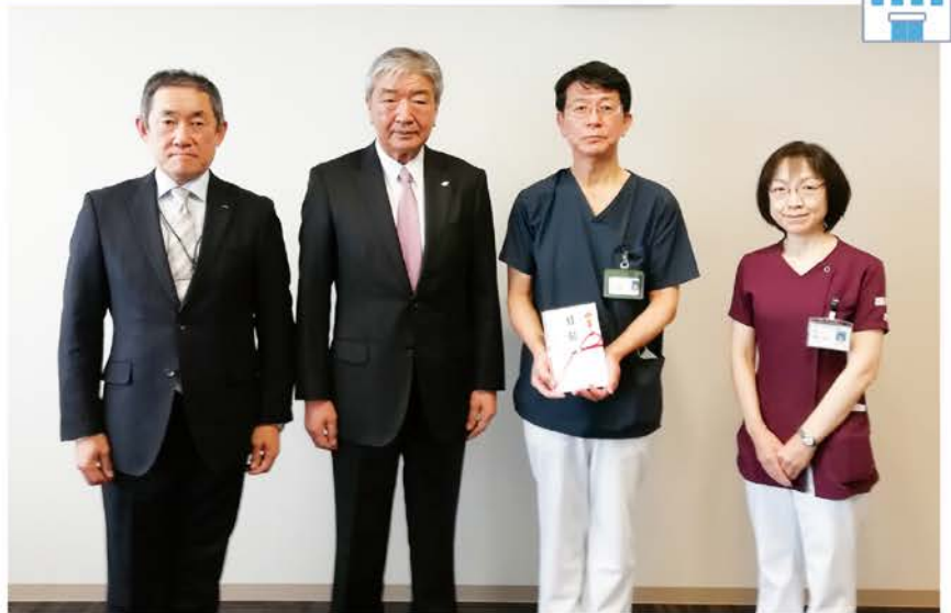
▲左より中村組合長、西井組合長、札幌厚生病院院長、宮崎看護部長

2月6日、札幌厚生病院に管内5JAからの目録を手渡しました。これは、新型コロナウイルス感染症の脅威が一向に収まらない中、最前線で感染症対応に取り組む札幌厚生病院の医療従事者に対して感謝と激励の意味を込めて、管内JA組合長会が企画したものです。