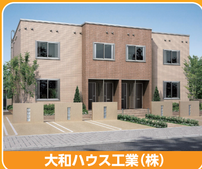
大和ハウス工業(株)