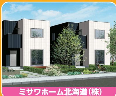
ミサワホーム北海道(株)