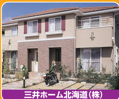
三井ホーム北海道(株)